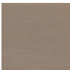
1142 Графит серебро